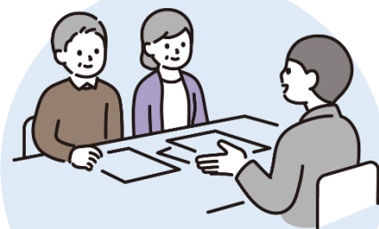
個別相談 (可能な場合)