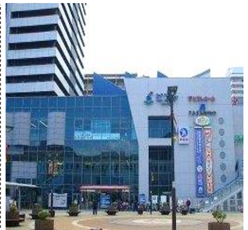
<ピフレホール外観>