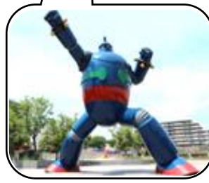
鉄人28号モニュメント

JR 神戸線：新長田駅 南側すぐ 神戸市営地下鉄：新長田駅 南側すぐ 神戸市バス：新長田駅前 東側すぐ